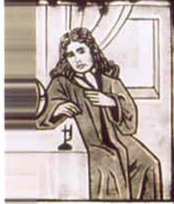
Antonie van Leeuwenhoek

ALL our KNOWLEDGE originates in our SENSIBILITIES