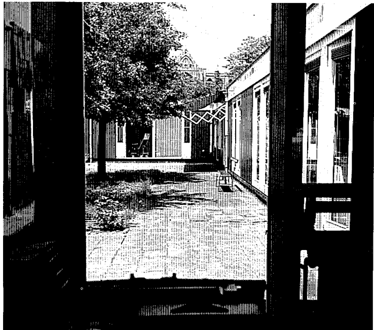
Een zicht op de binnenkoer van de afdeling Kinderziekten van het oud hospitaal.

RED. Ik denk dat we hier reeds veel belangrijke gegevens hebben, maar hoe bent u dan later aan die prefab Pediatrie gekomen?